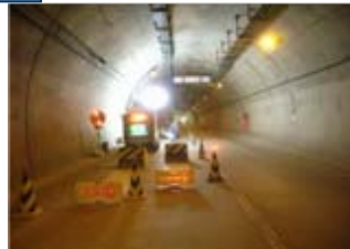
【トンネル内規制状況】